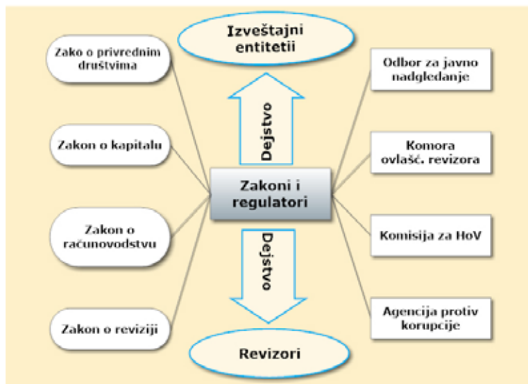
Fragmenti finansijske izveštajne scene u RS

Nacionalni regulator – podređen globalnom. Ili prihvata globalne stan- darde, ili nema verifikacije saglasnosti.